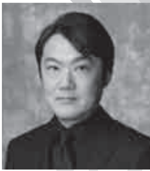
千住 明 Akira Senju (作曲家)

1960年10月21日東京生まれ。慶応大学工学部を経て東京藝術大学作曲科卒業。同大学院を首席で修了。修了作品「EDEN」は史上8人目の東京藝大買上、同大学美術館（芸術資料館）に永久保存されている。