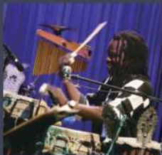
ンジャセ・ニャン(Per)