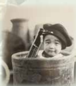
フクちゃん(2歳8ヶ月)

旅立ったことは 最大の悲しみではあるが あまり苦しまず『…ちょっと起こして』と言って小生に抱かれる姿勢で身体を委ねたことは 六十六年間の夫婦生活の最終章のエンディングとして 彼女らしい愛情ある幕の下ろし方であったと涙する。