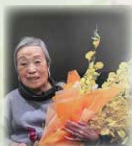
徹子の部屋収録日 (2023年12月25日)